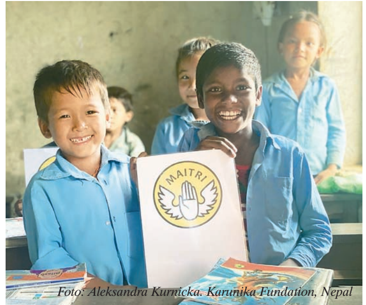
Karunika Foundation, Nepal