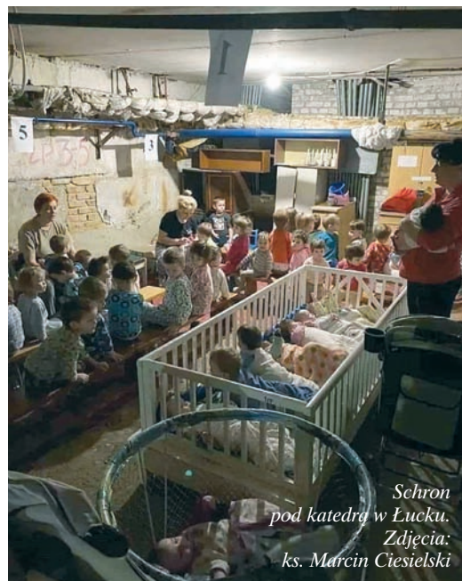
Schron pod katedrą w Łucku.